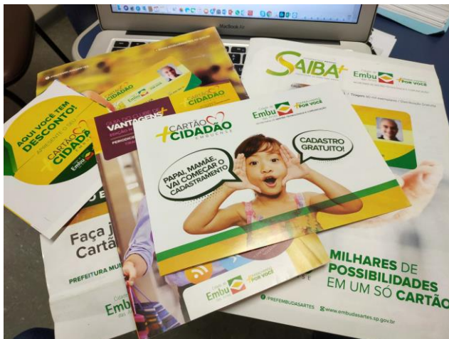
Figura 4 – Material de divulgação do serviço de cadastramento.

Apesar das medidas adotadas pela contratada em conjunto com a Prefeitura para prestação do serviço de cadastramento, constatamos que foram realizados 25.500 cadastros de cidadãos, o que corresponde a apenas 9,6% do total previsto no contrato (265.000 cadastros de munícipes estimados).